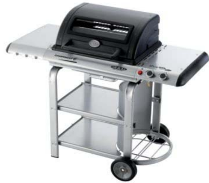
C-LINE 1900 S