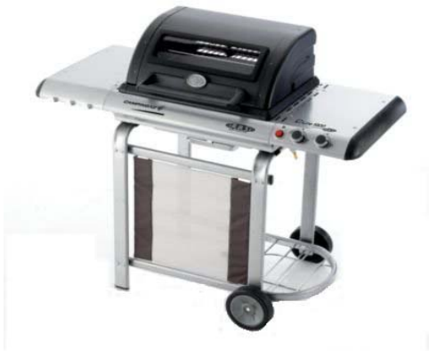
C-LINE 1900 & DELANO