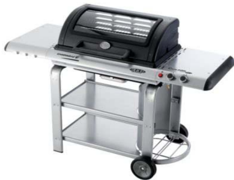
C-LINE 2400 S