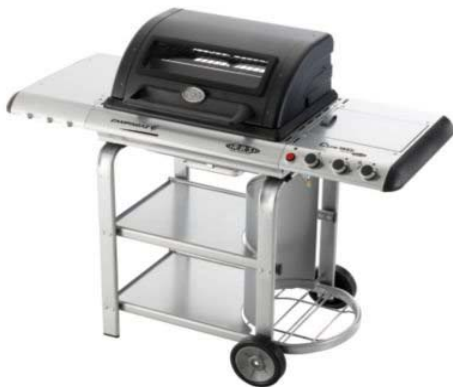
C-LINE 1900 D