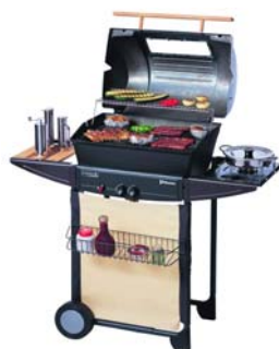
2000 R DELUXE