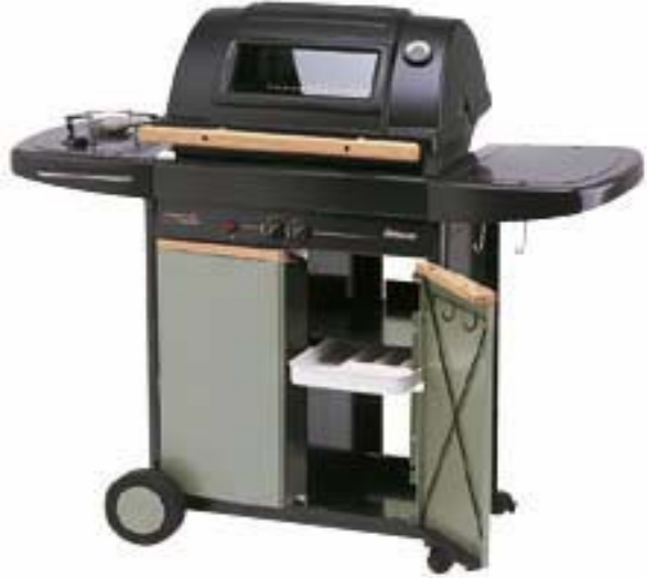
VIRTUOSO 2000 DELUXE