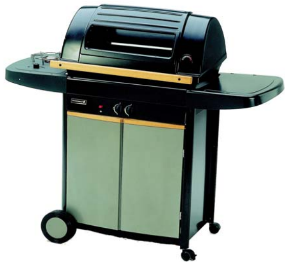
VIRTUOSO 2500 DELUXE